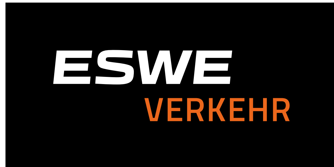
Logo Weiß und Orange