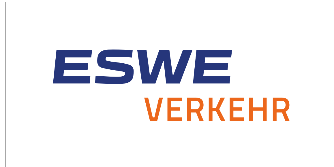
Logo Blau und Orange